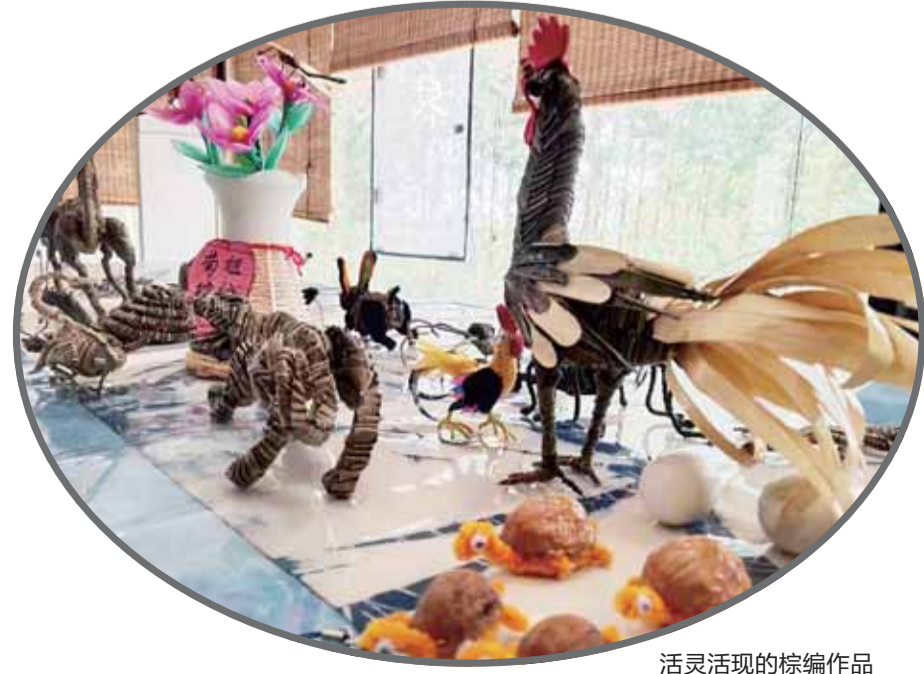
活灵活现的棕编作品

因为师傅住得远，教学不便，她只能通过微信跟他学艺，只要师傅发来学习资料和视频，她不管多晚，当天