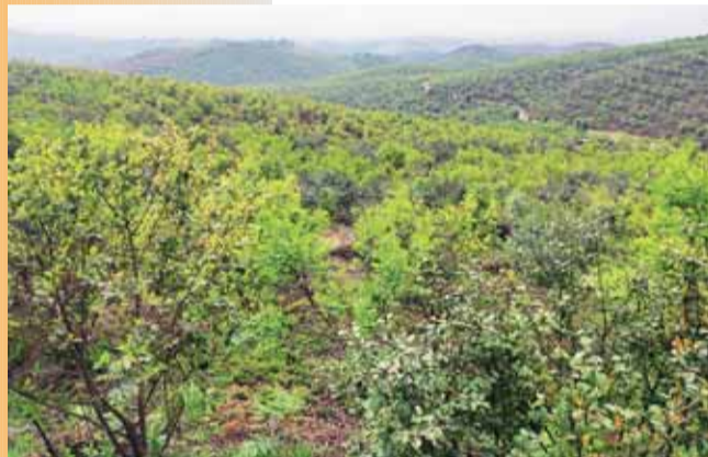
小流域水土流失治理成果