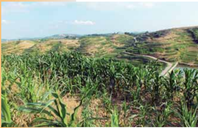
坡耕地水土流失综合治理工程成果