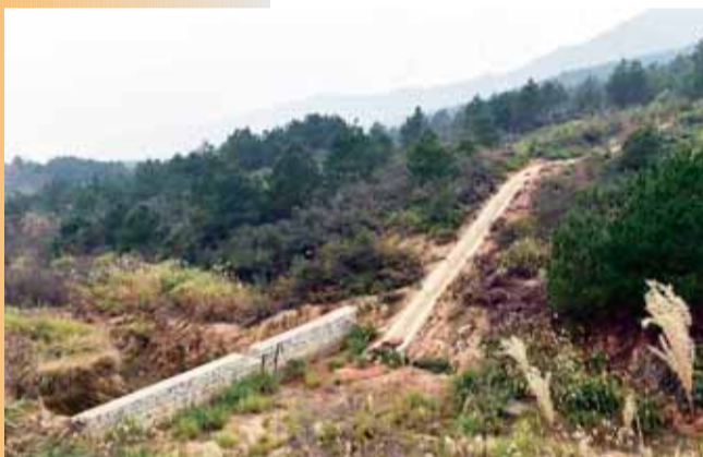
南方崩岗水土流失综合治理