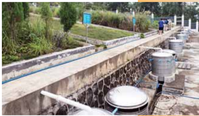
水土保持监测径流场