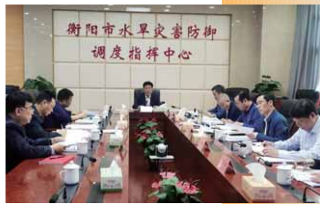
市水利局党委专题研究水土保持工作

(四)坚持问题导向,建立多元化投入机制。要坚持系统观念和问题导向,以小流域为单元,推进山水林田湖草综合治理,将水土流失防治与产业开发、结构调整、生态旅游、群众增收、乡村振兴相结合,充分调动各级各部门积极性和主观能动性,落实生态建设有关政策,抓好项目规划和实施,大力开展水土流失治理。同时,要调动全社会治理水土流失和改善生态环境的积极性,为建设生态优美新衡阳凝聚发展动能。