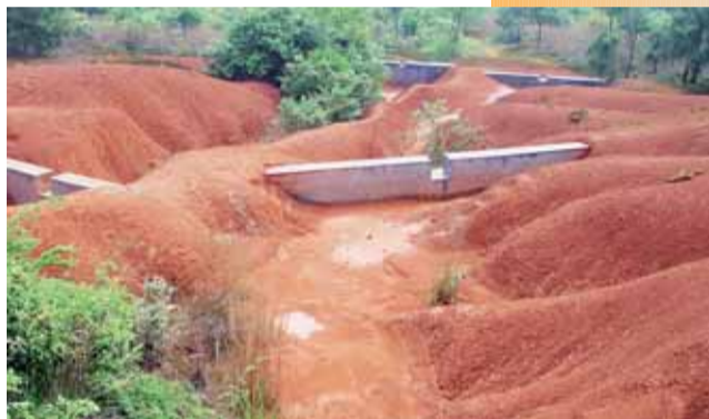
小流域水土流失治理工程(谷坊群)