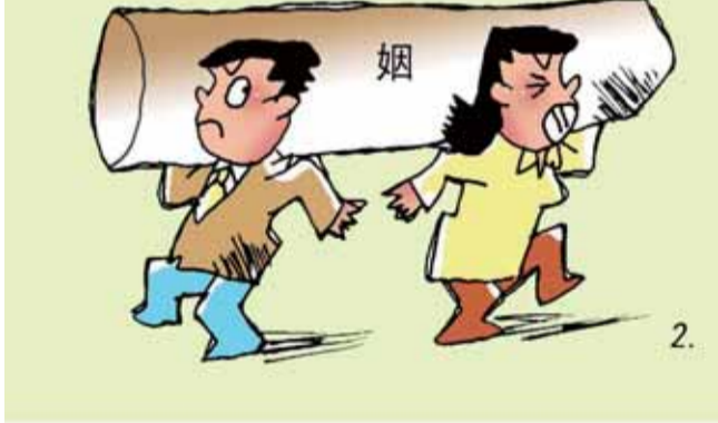
两对小夫妻 ■李肖庵